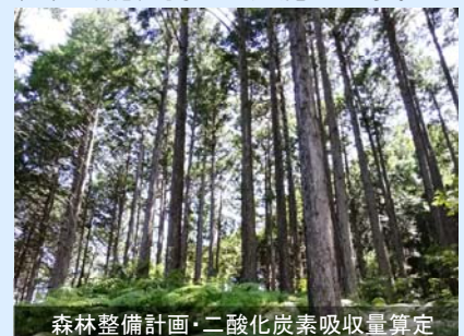
森林整備計画・二酸化炭素吸収量算定

社有林の森林整備計画、二酸化炭素吸収量算定を行います。また、小水力・太陽光・風力発電など再生可能エネルギー導入に伴う影響評価、可能性調査を実施します。