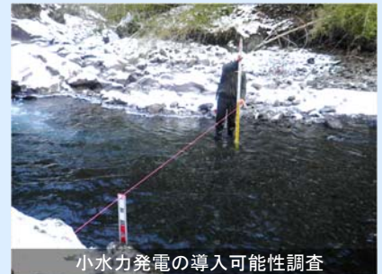
小水力発電の導入可能性調査