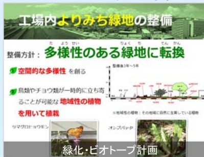
緑化・ビオトープ計画

事業所内の緑地を活用し、生物多様性に配慮した緑化・ビオトープ計画、動植物調査を行い、その魅力を情報発信することで、企業イメージのアップにつなげます。